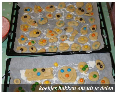
koekjes bakken om uit te delen

Per 25 mei is de nieuwe privacy wet ingegaan. Een vader wiens kinderen regelmatig meedoen aan onze activiteiten, attendeerde ons er op dat foto's van zijn kinderen in onze nieuwsbrief zijn gekomen, terwijl hij zelf niet achter ons werk kan staan. Bij deze namens hem de vraag om de betreffende brieven te verwijderen van uw pc. (januari 2016, maart 2017 en november 2017).