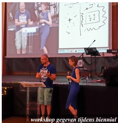
workshop gegeven tijdens biennial

In de meivakantie kwam er een jeugdgroep uit een kerk in Vroonshoop naar het zuiden. Woensdag 2 mei mochten we deze groep ontvangen. “Handen uit de mouwen” is hun naam en motto. Dat hebben ze waargemaakt! Ze hebben bij enkele mensen in onze buurt de verwilderde tuin opgeknapt. Een gave kans om voor mensen tot zegen te mogen zijn.