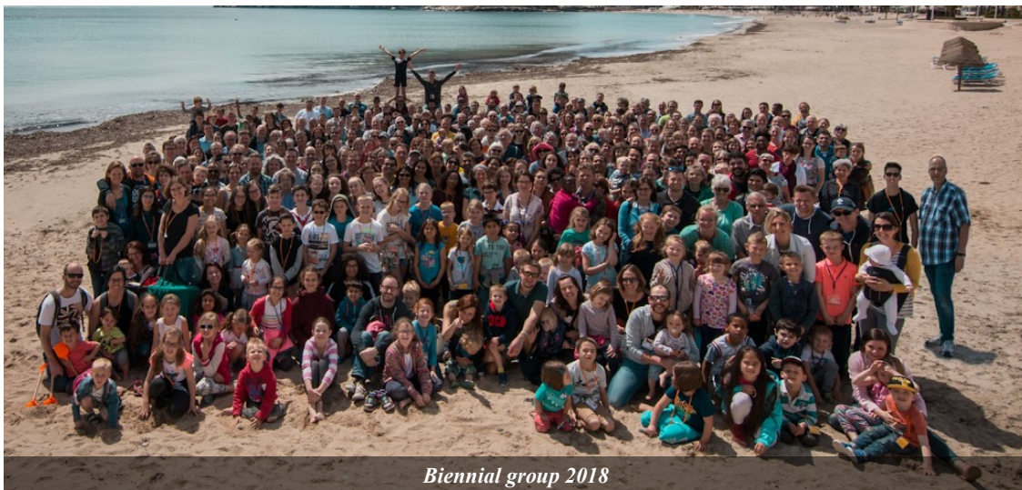
Biennial group 2018

Met het oog op alle kinderen in de community, zijn vooral onze vieringen van karakter veranderd. We houden iedere maand een zondagse viering van 11 uur tot na de lunch. Tijdens een viering pakken we samen (jong en oud, christen en niet-christen) een thema uit. In het bijbelverhaal, de beelden en het spel staat één