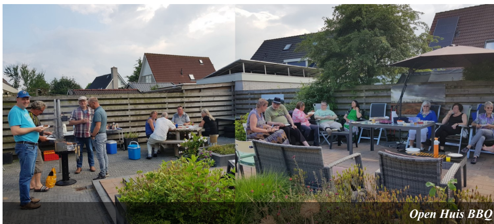
Open Huis BBQ