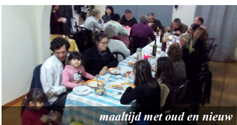
maaltijd met oud en nieuw