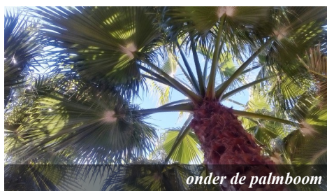
onder de palmboom