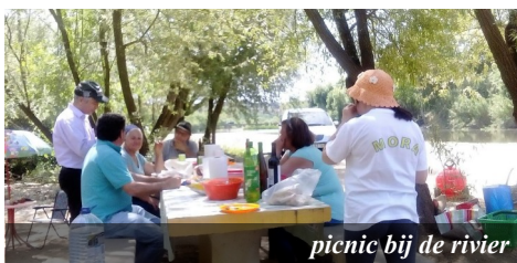
picnic bij de rivier