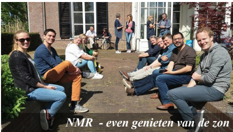
NMR - even genieten van de zon

Het Open Huis is voor ons een middel om eenzaamheid tegen te gaan. Dit doen we door een huiskameromgeving aan te bieden waarin iedereen zich veilig voelt, zichzelf mag zijn en gezelligheid ervaart. Tevens is het een gelegenheid tot het gaandeweg aangaan van diepere