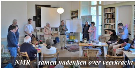
NMR - samen nadenken over veerkracht