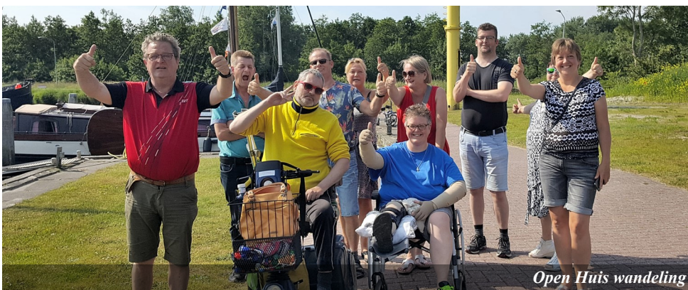
Open Huis wandeling

relaties, waardoor we iets kunnen laten zien van wat het leven met Jezus inhoudt.