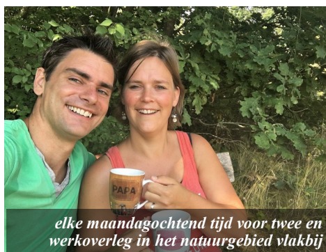
elke maandagochtend tijd voor twee en werkoverleg in het natuurgebied vlakbij

Ook barbecueën we af en toe met iedereen uit de buurt die maar wil. Meestal zijn dat dan zo'n twintig personen, inclusief kinderen. Iedereen neemt iets mee. Uiteraard houden we ons ook hier aan de voorgeschreven regels. We merken dat veel burens hier echt van genieten: van het geluid van spelende kinderen, van de gezelligheid, de open sfeer, het leven. Met name oude burens, die niet van hun balkon afkomen of zomaar uit het raam hangen, genieten zichtbaar met een grote lach op hun gezicht. Ook een klein praatje met hen doet heel goed. Van beide kanten overigens. Zelf genieten we ook erg van deze momenten en we zijn God dankbaar voor deze buurt en de contacten die we hebben.