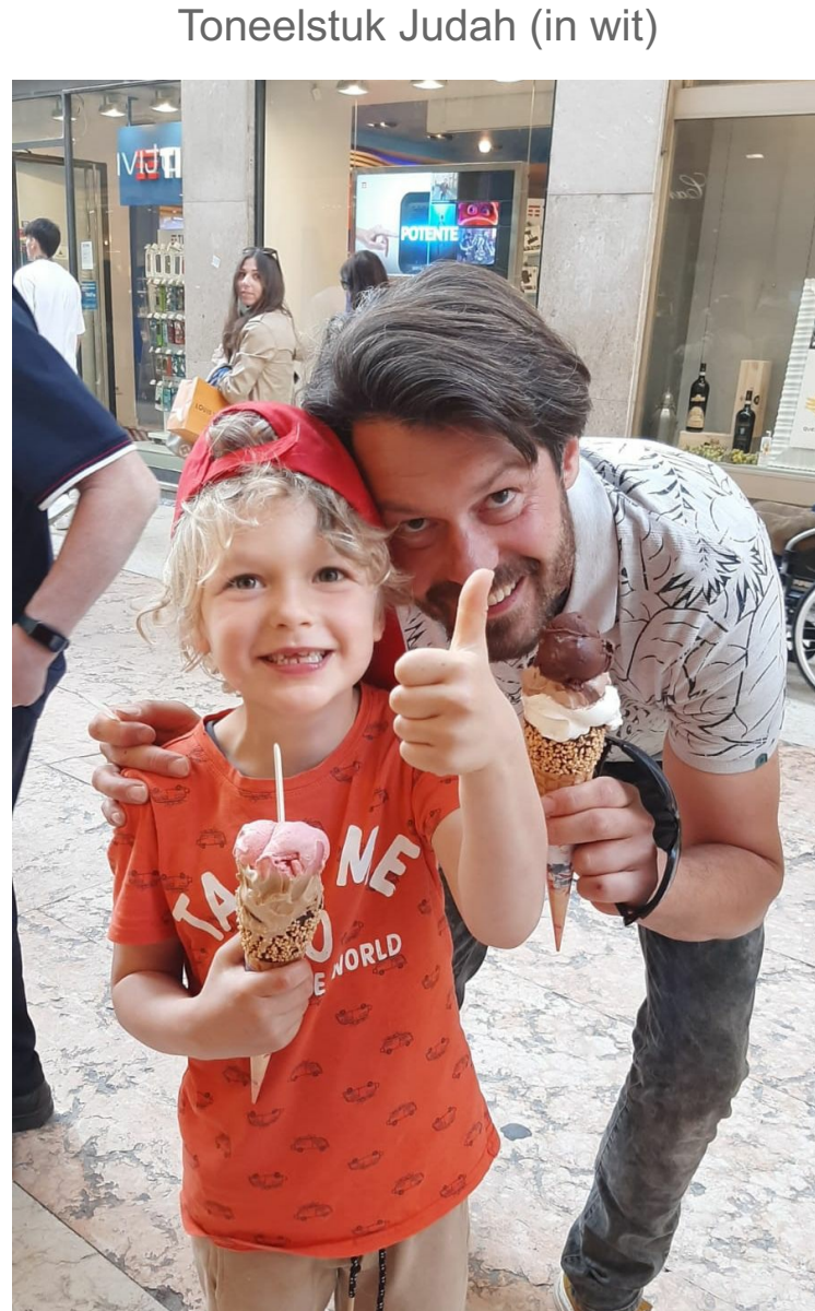
Verwend door opa en oma :-)