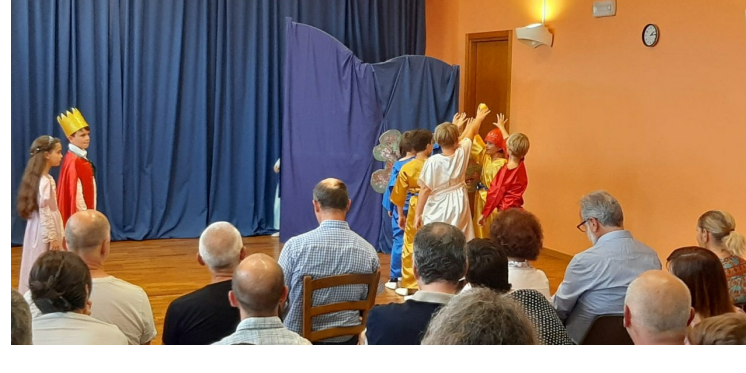
Toneelstuk Judah (in wit)