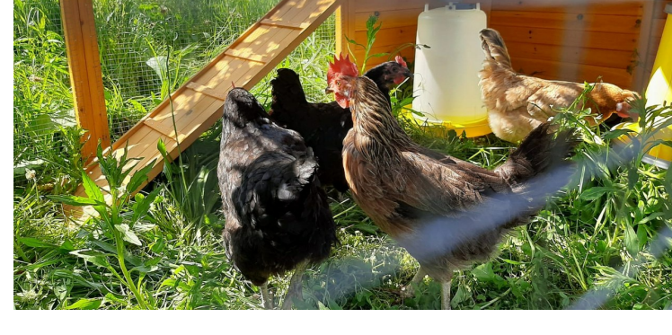
Tante Truus en haar zussen