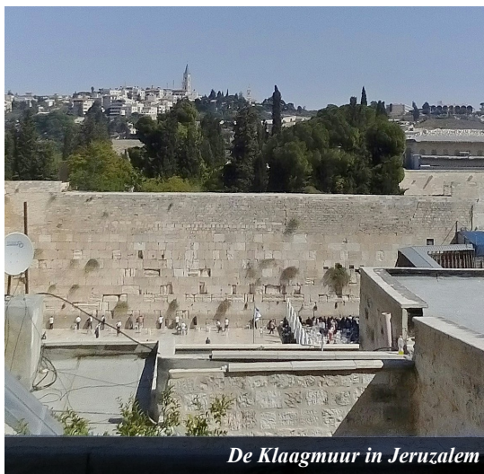
De Klaagmuur in Jeruzalem