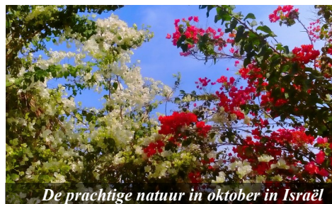
De prachtige natuur in oktober in Israël

Stuur ons dan even een berichtje via arendjan.zwart@ecmi.org