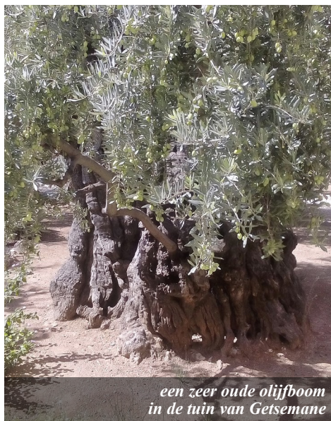
een zeer oude olijfbom in de tuin van Getsemane